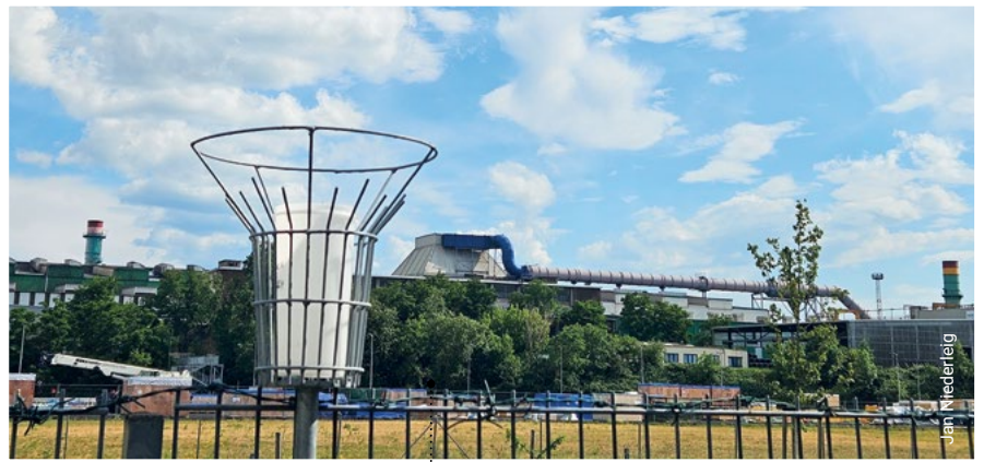
Nach 20 Jahren Streit, nun friedliche Nachbarschaft in Riesa

Durch eine gerichtliche Mediation beim Verwaltungsgericht Dresden ist es gelungen, eine in Riesa seit über zwei Jahrzehnten bestehende Konfliktsituation zwischen einzelnen angrenzenden Anwohnern, dem Unternehmen FERALPI STAHL, das am Standort ein Stahlwerk und zwei Walzwerke betreibt, und dem Freistaat Sachsen einvernehmlich zu beenden.